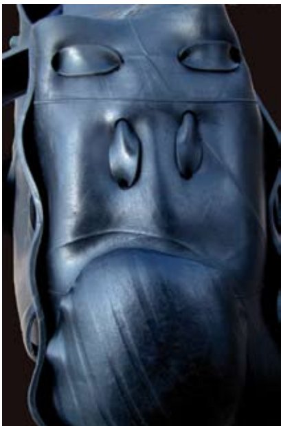
Le photographe Claude-Charles Mollard propose une série d'images anthropomorphes représentant des visages inquiétants, grimaçants et énigmatiques nommés Origènes. Ceux-ci proviennent d'objets manufacturés, de bidons abandonnés, de rebuts de la société urbaine.