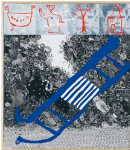
Notre compatriote Christian Silvain explore dans ses tableaux la nostalgie et le pouvoir onirique d'une enfance à jamais disparue, où subsistent cependant une mystérieuse écriture entourant des personnages de contes et de dessins animés menacés par d'effrayantes figures échappées de cauchemars récurrents.