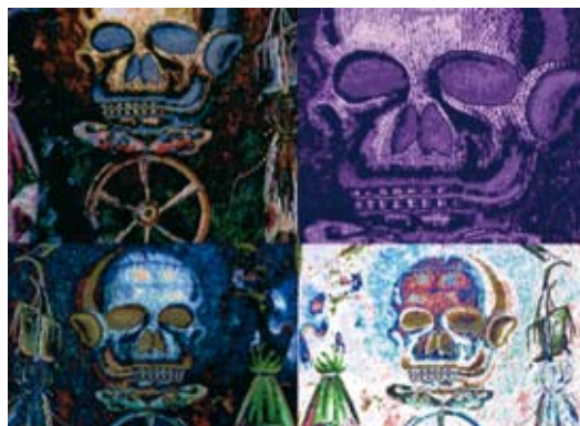
Caspar développe dans ses vidéos "Immediatus", réalisées sur l'exceptionnel site de Pompéi, le sentiment de vanité et de fugacité des choses face à cette vie ensevelie par la lave.