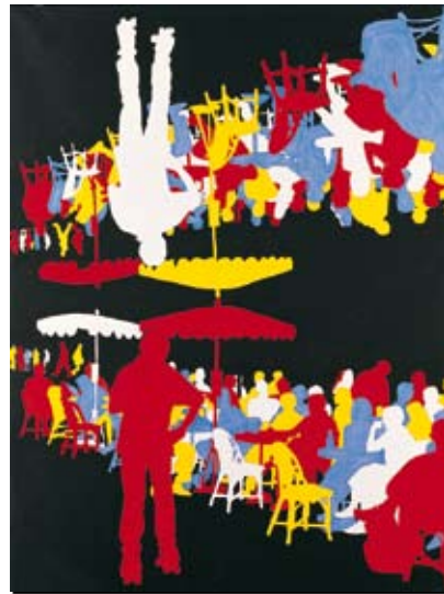
Les toiles de Gérard Fromanger se caractérisent plutôt par une figuration narrative. Ce peintre explore un univers urbain avec ses codes, ses rites et ses mythologies.

Jusqu'au 8 juillet, à la Galerie Up'Art, Quai au Bois de Construction 4 à 1000 Bruxelles. Tél. 0486.455.435. Ouvert du mercredi au vendredi de 15h à 18h30 et le samedi de 11h à 17h ou sur rendez-vous.